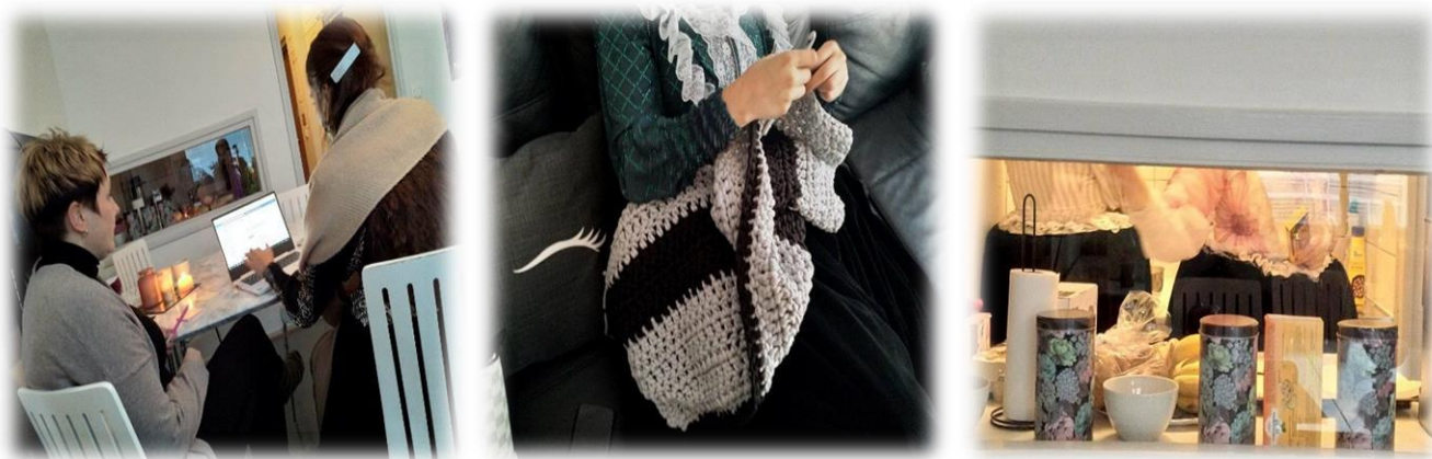
Kuvasarja: Ohjaus ja harrastetoimintaa tukipisteellä

Tukipiste toimi yhdyskuntapalvelu- ja koevapausasiakkaille velvoitteen suorittamispaikkana, sekä rikosseuraamus-viranomaisten kanssa tehtiin aktiivista yhteistyötä. Tukipisteellä oli myös opiskelijoita suorittamassa opinnäytetöitään.