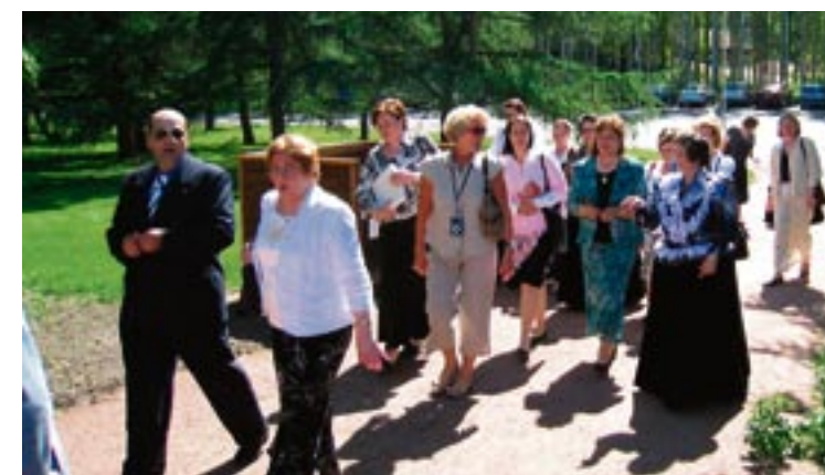
Romaniasia- in neuvottelukunnan edustajat vierailivat ju- hannuksen jälkeen Kultarannassa tasavallan presidentin Tarja Halosen luona. Mukana tapaamisessa oli roma- niasia- in neuvottelukunnan ja opetushallituksen romanien koulutuspalvelujen edustajia sekä romanipoliittisen oh- jelman työryhmän edustajia.

Toimenpiteiden kohteina nousivat erityisryhmät, kuten yk- sinhuoltajat, nuoret perheet tai syrjäytymisuhanalaiset,