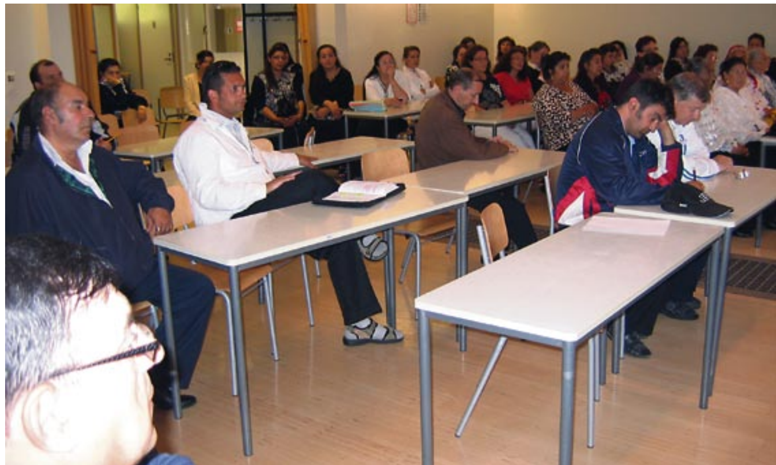
Kurikan romanileirin aiheena oli tulevaisuus, millainen romani on 20 vuoden kulltua. Aihe kirvoitti laajaa ja syvällistä keskustelua.

Pohjanmaan sydämessä oli nähty, että orastava yhteistyö koulutoimen ja kirkon kanssa saattaa olla positiivinen tie vaikuttaa romaniperheiden arkeen ja kouluasioihin. Romanilasten perusopetuksen tukemisen kehittämistoiminta alkoi opetushallituksen tuella neljästätoista kunnassa vuonna 2008. Kurikan kaupunki on yksi tuen saaja. Kurikka on lähentynyt innokkaasti toteuttamaan kehitystyötä. Paikallisen kehittämistyön ympärille on koottu monialainen ohjaustyöryhmä, johon kuuluu sekä romaneita että pääväestön virkamiehiä ja toimihenkilöitä. Heidän tehtävänä on ollut miettiä kotiin ja koulun välistä yhteistyötä, solmukohtia ja ratkaisumalleja todellisiin haasteisiin.