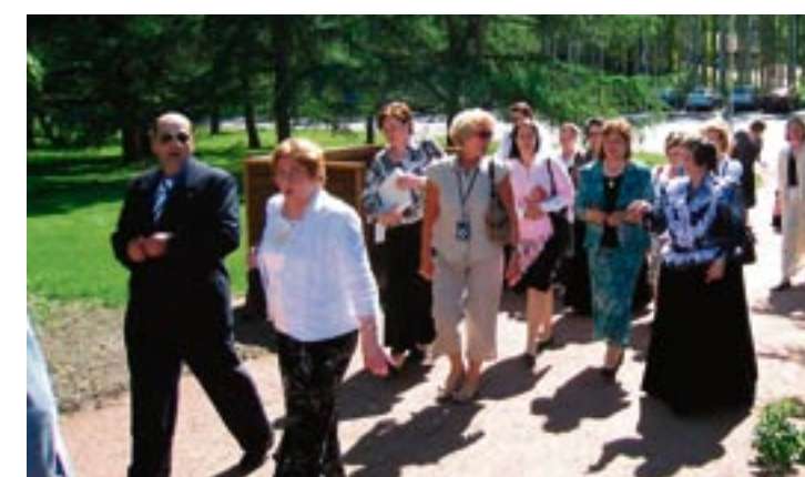
Romaniasia-ain neuvottelukunnan edustajat vierailivat juhannuksen jälkeen Kullarannassa tasavallan presidentin Tarja Halosen luona. Mukana tapaamisessa oli romaniasia-ain neuvottelukunnan ja opetushallituksen romanien koulutuspalvelujen edustajia sekä romanipoliittisen ohjelman työryhmän edustajia.

Tuettiin vilkkaan keskustelun jatkumisesta huolehti kuulemistilaisuuksien dramaturgin kaari. Romanikieltä koskevat keskustelut käytiin aivan lopuksi ja niistä syntyivät myös suurimmat näkemyserot. Yhtä mieltä oltiin kuitenkin siitä, että romaniväestöllä itsellään on suurin vastuu kielen säilymisessä, ja että kieli pitäisi elvyttää puhutuksi arkikieleksi. Kokonaisuudessaan tilaisuuksissa